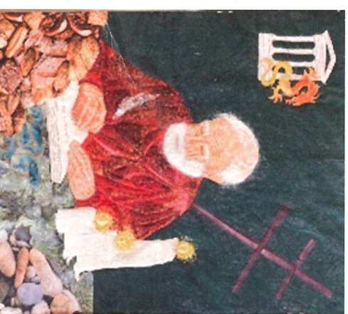
I februar, marts og april kan ”Nadvergæsterne” ses i våbenhuset i Hasseris Kirke.

Udstillingen blev første gang vist i påskeugen 2023 i Stoense Kirke. Derefter var den udstillet i Københavns Domkirke i sommeren 2023. Siden har den været vist i Thisted Kirke, Bagsværd Kirke, Vestervang kirke i Viborg og senest i Helligåndskirken i Aarhus.